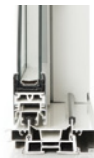
Angle de couissant 2 rails Vue de face